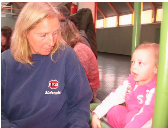
..... „Itzi“, ich will jetzt nach Hause .....