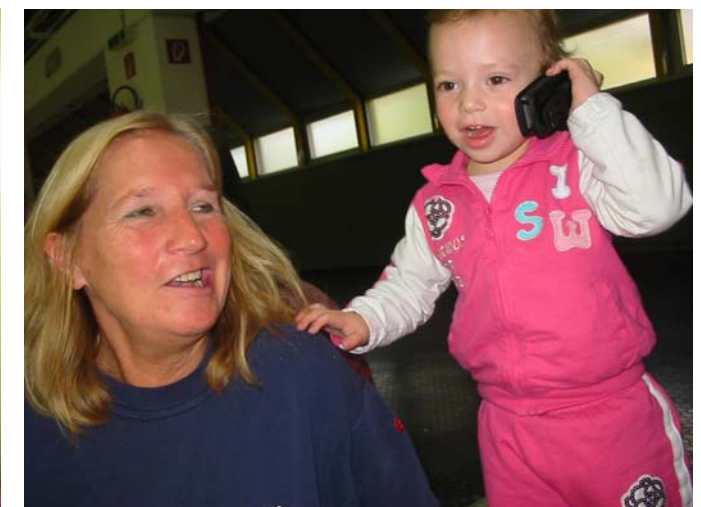
..... Hallo Mama, ja, ja, wir haben gewonnen .....