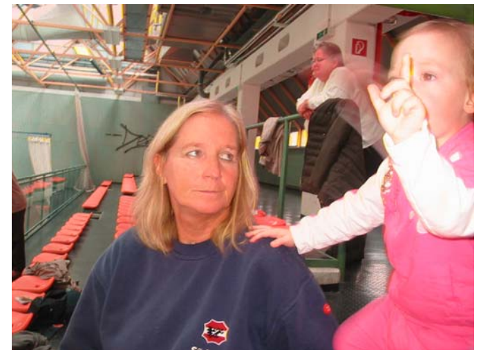
.....Halbzeit: Juhu, wir sind in Führung .....