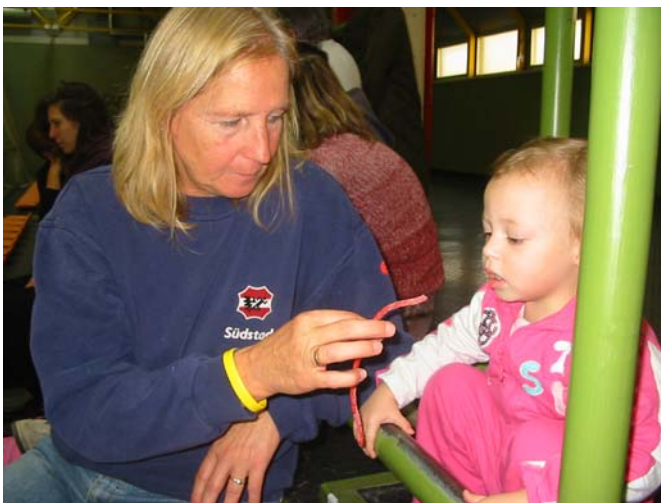
.....sich aber nochmals „überreden“ lässt .....